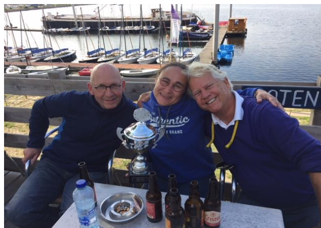
Het winnende team!